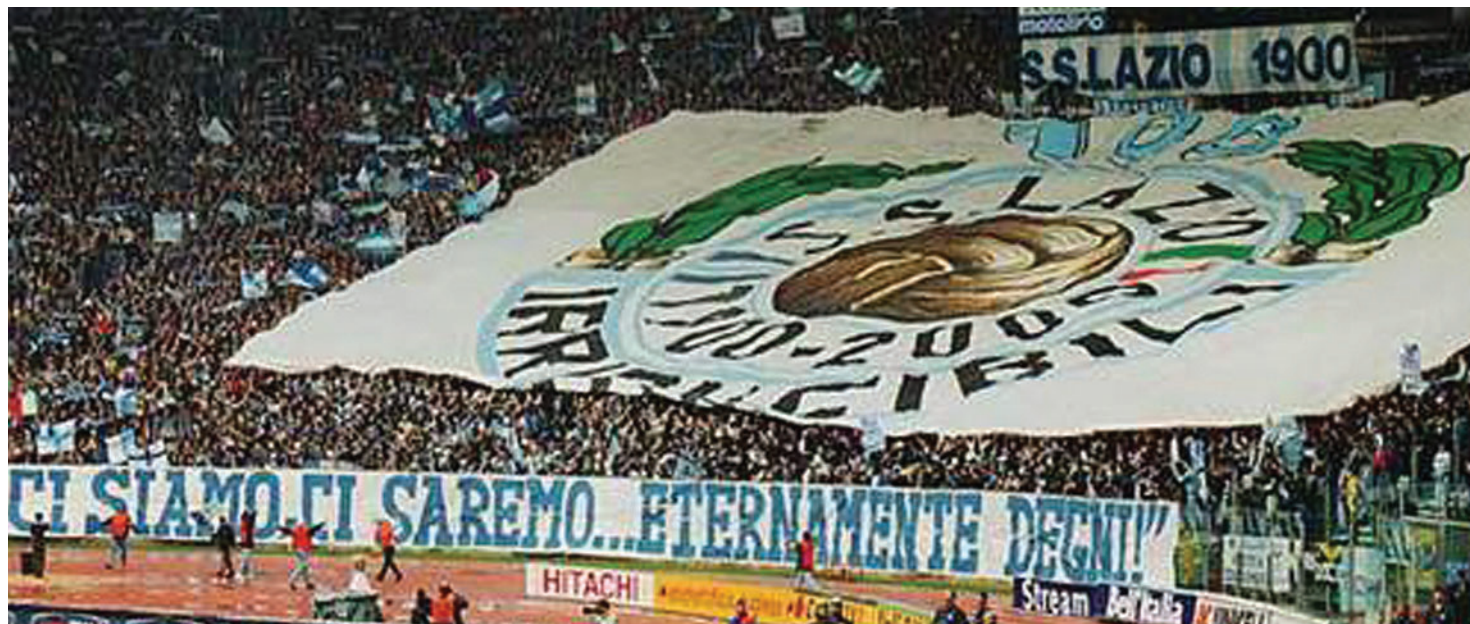
Un'immagine della curva nord della Lazio

L'ultima vittoria della Lazio risale al 10 dicembre 2006 un clamoroso 3-0